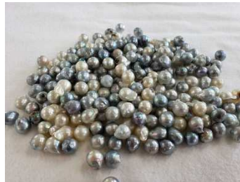
②宝飾品に使用できない真珠を選別し、真珠層と核を分離し、漂白処理