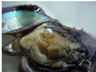
①アコヤ貝から真珠を取り出す