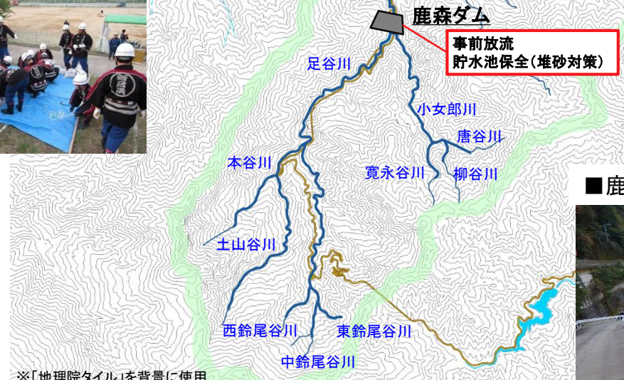
※「地理院タイル」を背景に使用