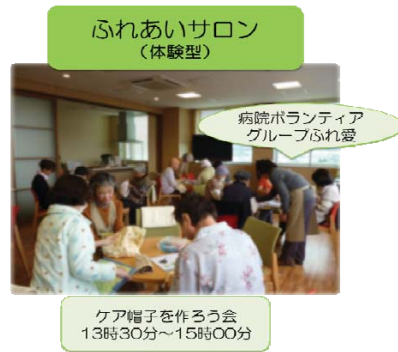
ふれあいサロン (体験型)