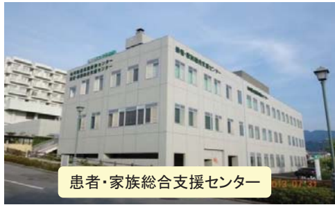
患者・家族総合支援センター