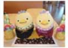
新年モードの暖だんのバリエーションです