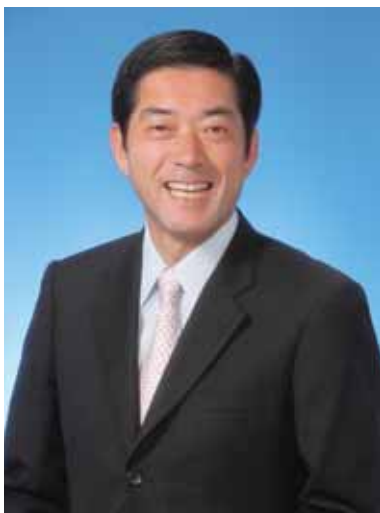
愛媛県知事 中村 時広