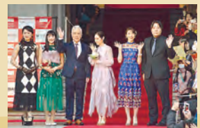
2019年イベント時の様子