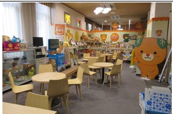
県民総合相談プラザ（みきゃんセンター）