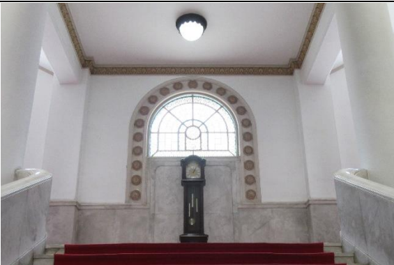
時計のある踊場へ