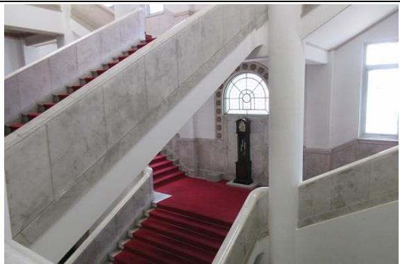
3階から階段を見下ろしたところ