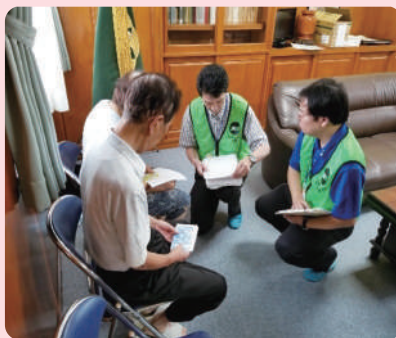
アセスメント・個別指導