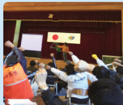
生活不活発病予防の体操指導