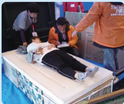
避難所設置・運営訓練の様子