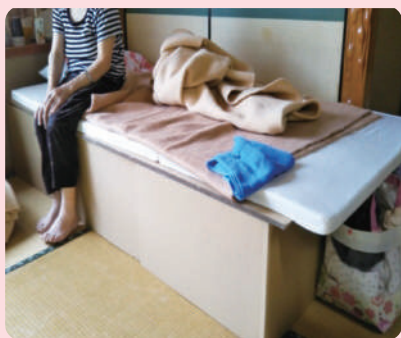
ダンボールベッドの設置