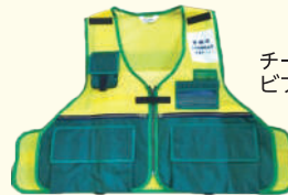
チーム員用 ビブス