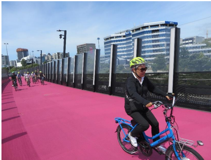
(ゆとりある自転車専用道)

説明を終えメンバーで街中を少し自転車で走ってみると、なるほど、確かに専用自転車道のピンクレーンの走りやすさは心地良く、自転車専用の信号機も街中に溶け込んでいた。