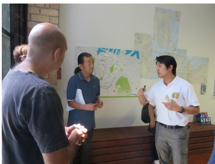
(オークランド市街地で自転車専用道の整備状況を聞く)

又、実はサイクルトレイルを整備しようとする中で、当初オークランドは考えになかったが、北と南を整備するに当たって中間にあるオークランドは外す事が叶わず整備を始めた経緯がある。しかしながら、先にも述べたようにラグビーやヨット等による観光客や常に立ち寄るクルーズ船からの観光客に湧くオークランドにおいての自転車観光の目は大きい。何よりこのニュージーランドのサイクルトレイルを走破する事は、45 歳以上に人気があり死ぬまでにやるべき事の一つに入っているという。