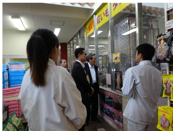
株式会社御菓子御殿 （読谷村）