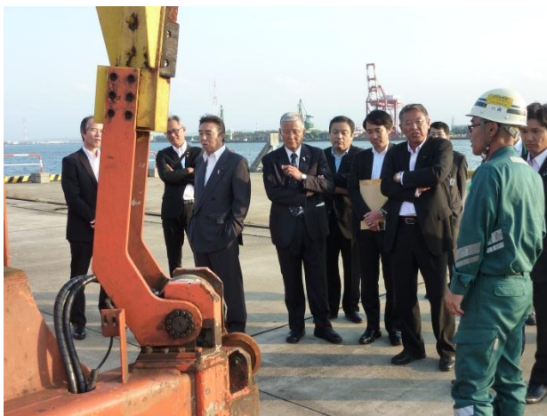
伏木富山港多目的国際ターミナル （富山県射水市）