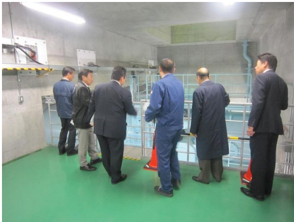
シューパーロ発電所 （夕張市）