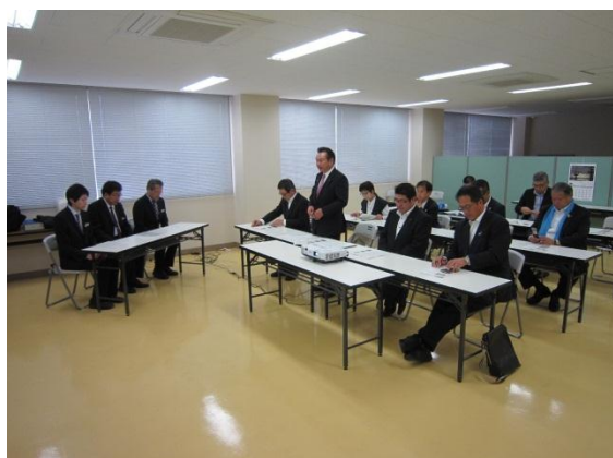
石巻港湾事務所 （宮城県石巻市）