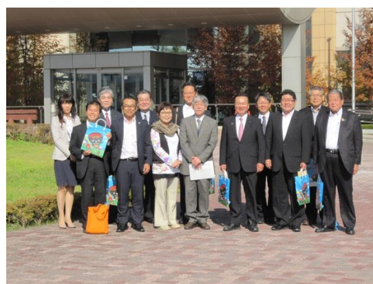
岩手県環境保健研究センター （岩手県盛岡市）