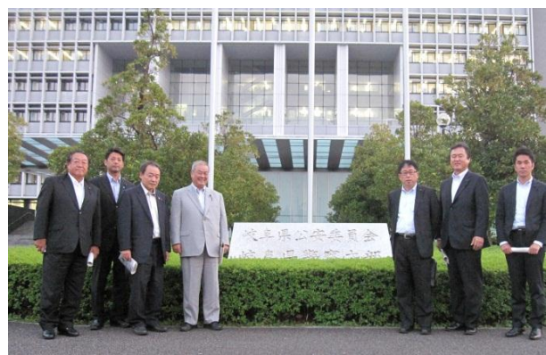
岐阜県警察本部 (岐阜県岐阜市)