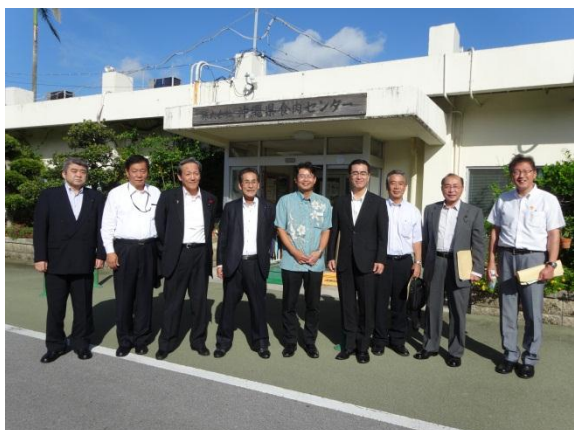
株式会社沖縄県食肉センター （南城市）