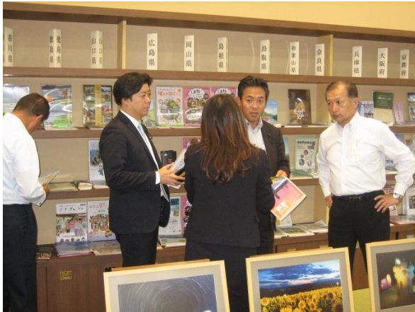
移住・交流情報ガーデン (東京都)