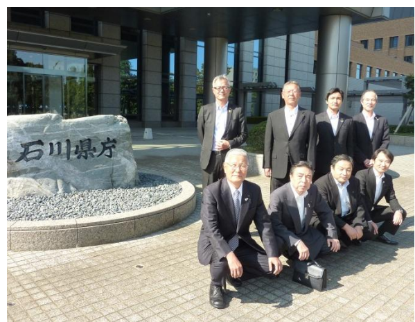
石川県庁 （石川県金沢市）