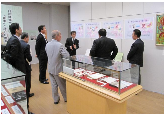
福井県ふるさと文学館 (福井県福井市)