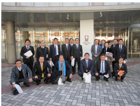
今治タオル工業組合 (今治市)