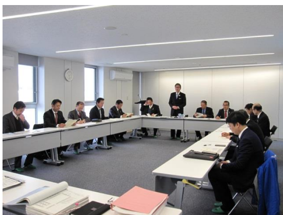
子ども若者発達支援センター （四国中央市）