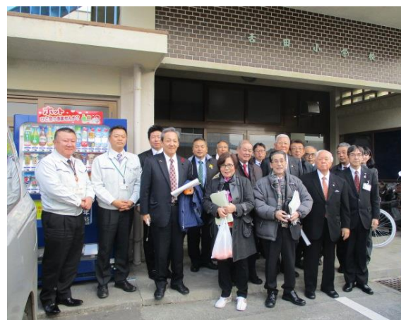
みかんの里宿泊・合宿施設 マンダリン (八幡浜市)