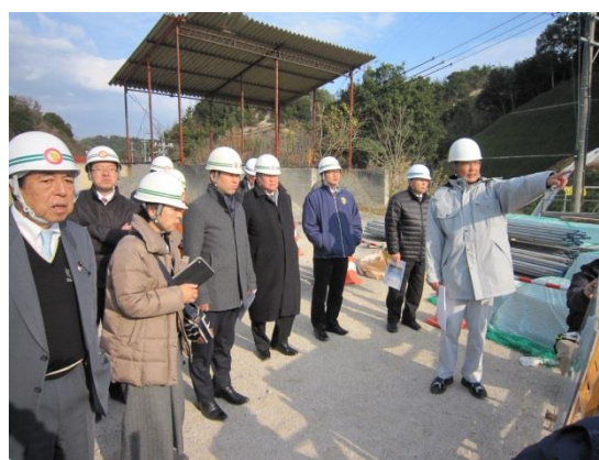
県道岩城弓削線岩城橋建設現場 (越智郡上島町)