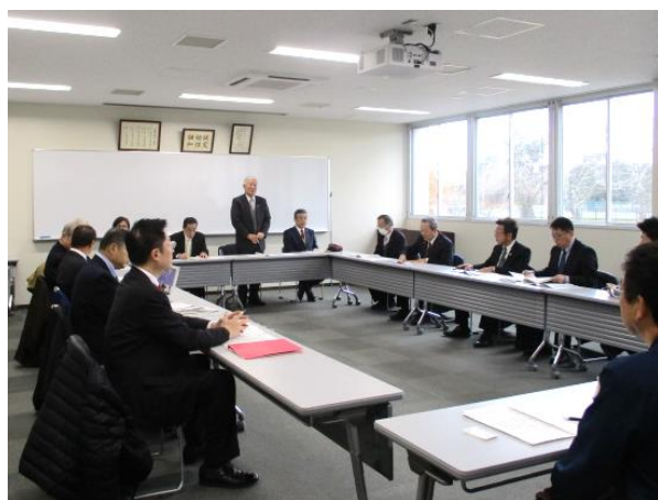
県警察機動隊 (東温市)