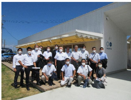
サイクリスト総合施設 WAKKA （今治市）