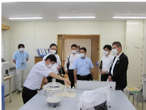
窯業技術センター （砥部町）