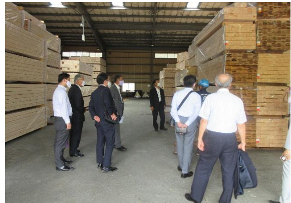
八幡浜官材協同組合 (大洲市)