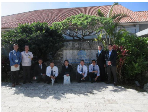
みやこ下地島空港ターミナル (沖縄県宮古島市)