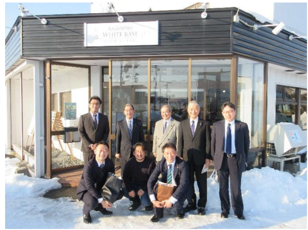
ながぬまホワイトベース （北海道夕張郡長沼町）