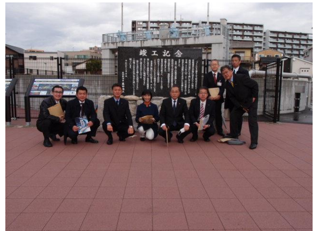
高尾川地下河川流入施設 (福岡県筑紫野市)