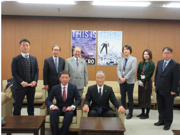
札幌市役所 （北海道札幌市）