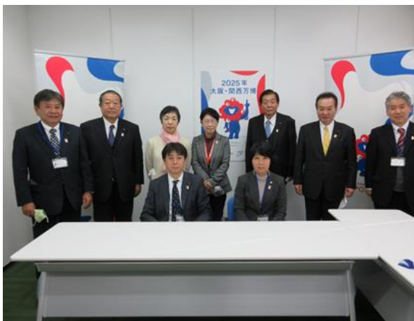
2025年日本国際博覧会協会 （大阪市住之江区）