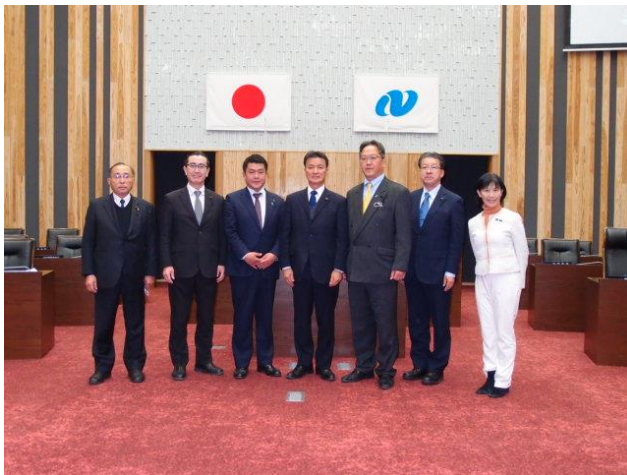
長崎県議会 (長崎県長崎市)