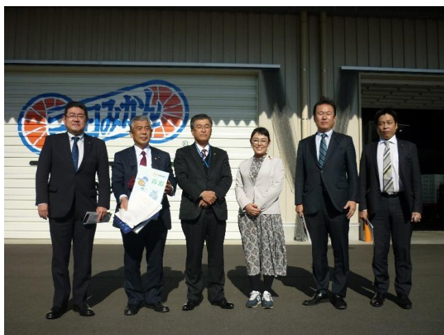
静岡県三ヶ日町農業協同組合 (静岡県浜松市)