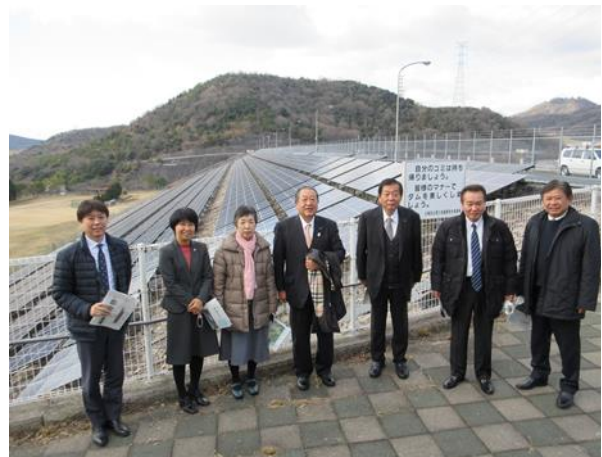
兵庫県企業庁 権現ダム （兵庫県加古川市）