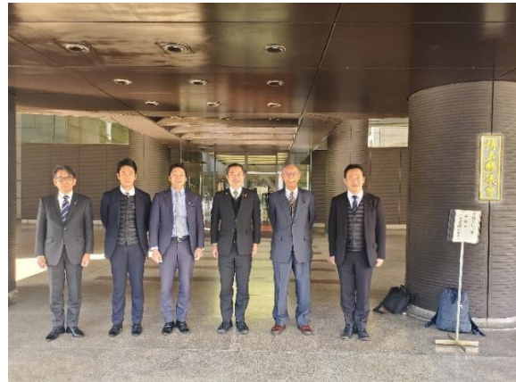
埼玉県庁 (埼玉県さいたま市)