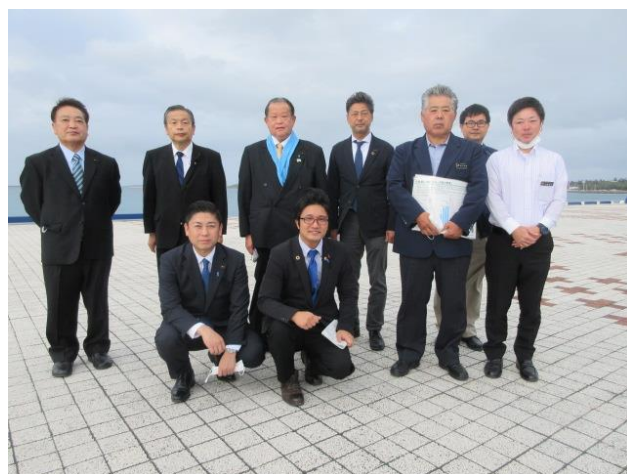
平良港クルーズ船専用バース (沖縄県宮古島市)