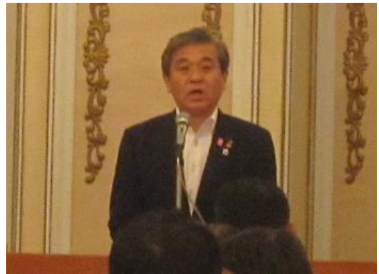
来賓挨拶：神野 一仁 [愛媛県副知事] (愛媛県知事代理)