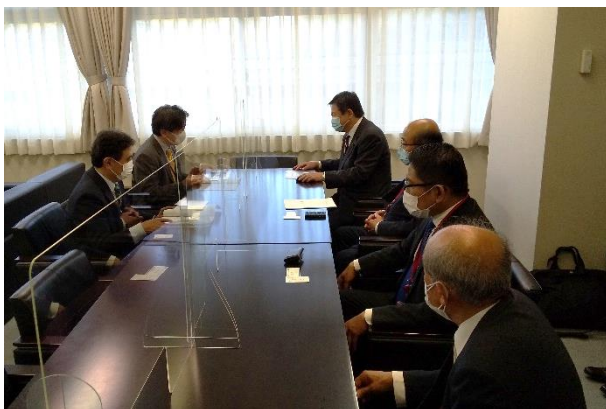
久保田審議官、金井審議官に要望