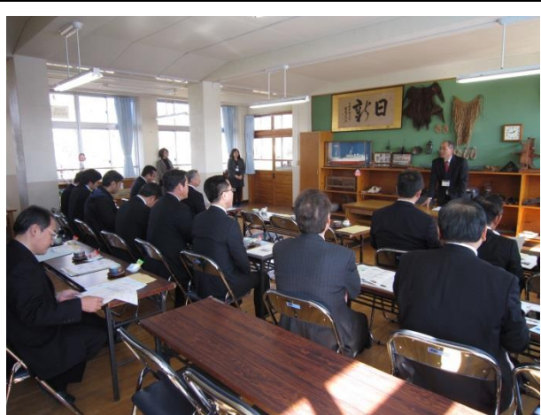
隈之城小学校の説明の様子