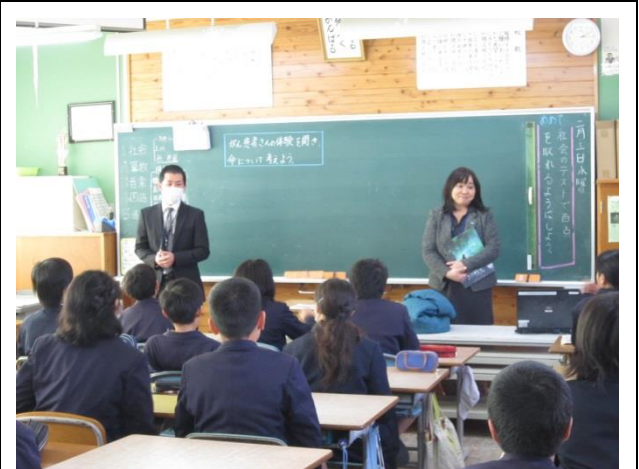
「いのちの授業」の視察の様子