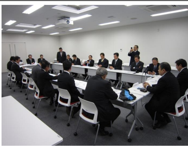
広島県の説明の様子