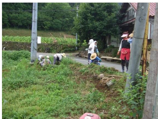
【非農業者らと共に景観作物を植栽】

年2回実施している共同草刈り作業による集落内農地の美化活動や共同利用機械による農地整備等を行い、農地周辺の作業環境の向上を図った。また、非農業者らと共に景観作物の植栽・管理を行い、環境美化の活動を行った。