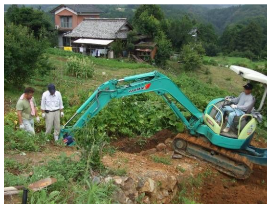
【共同利用機械による農地の整備】