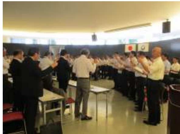
全員による唱和を行うようす