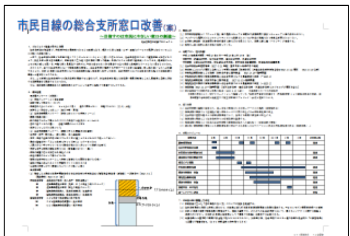
小集団活動 A3企画書

トヨタでは、企画内容を1枚の紙にまとめる技術を入社後の早い段階から叩き込まれる。内容を分かり易く端的にまとめる技術は、改善活動のみならず、行政職員としても当然に必要なスキルである。改善活動は、仕事への取り組み方という意識上の変革は勿論のこと、業務上必要とされる各種スキルの獲得にも一役買っている。