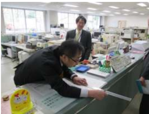
小集団活動に基づきカウンターを実測する職員

また、参集者は和やかな雰囲気の中なかで経験年数に関係なく自分の意見を述べることができ、成功体験を積みあげ、更なる改善に熱意を燃やすという好循環が生み出されている。