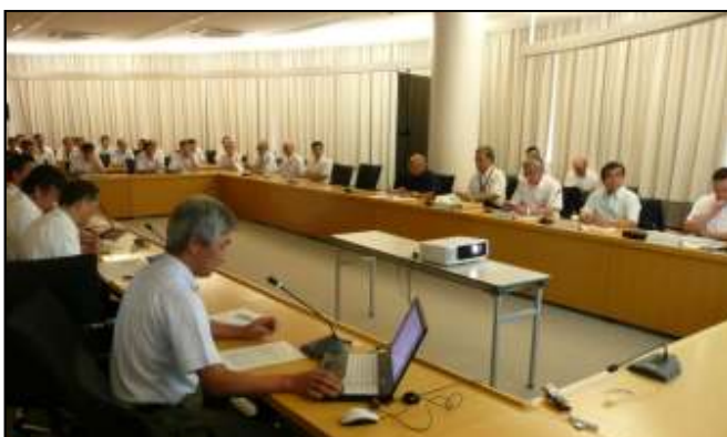
事例発表会のようす

◆本市では、業務改善活動の積極的な横展開を図るため、毎月、市長・副市長・教育長をはじめ全幹部職員参集のもと事例発表会を実施して全庁への周知を図っている。優れた事例は、組織の壁に関係なく「横展開」を促進している。