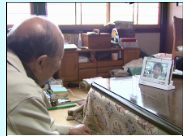
端末を利用してビデオ通話する高齢者

高齢者をターゲットにした事業におけるサポート及び料金徴収については、顔の見える地元事業者の協力が不可欠