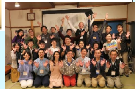
ローカルベンチャースクール