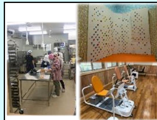
施設の主なスペース