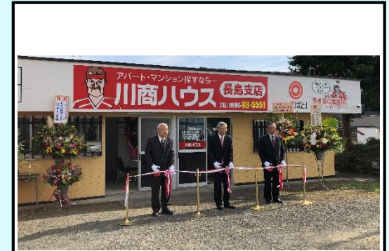
長島町初の不動産事業者を誘致