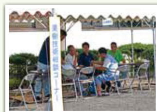
▲果樹技術相談コーナー