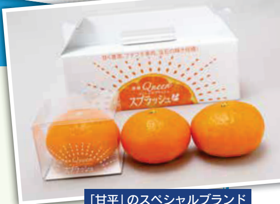
「甘平」のスペシャルブランド (愛媛クイーンズブラッシュ)