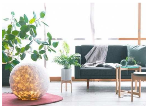
写真 モダンな生活空間を演出するプロダクト

本事業で開発した製品は、伝統的な産業の新たな需要を掘り起こす製品として期待できます。また、地域の伝統産業の更なる振興を図り、地域経済の活性化が期待できます。