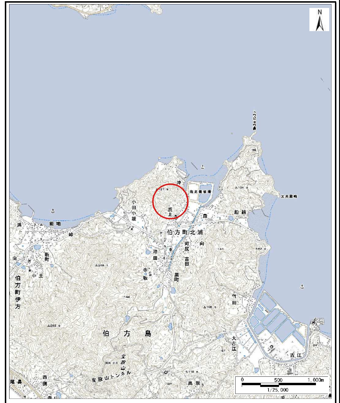
様式-1 (土) 土砂災害警戒区域・土砂災害特別警戒区域 位置図