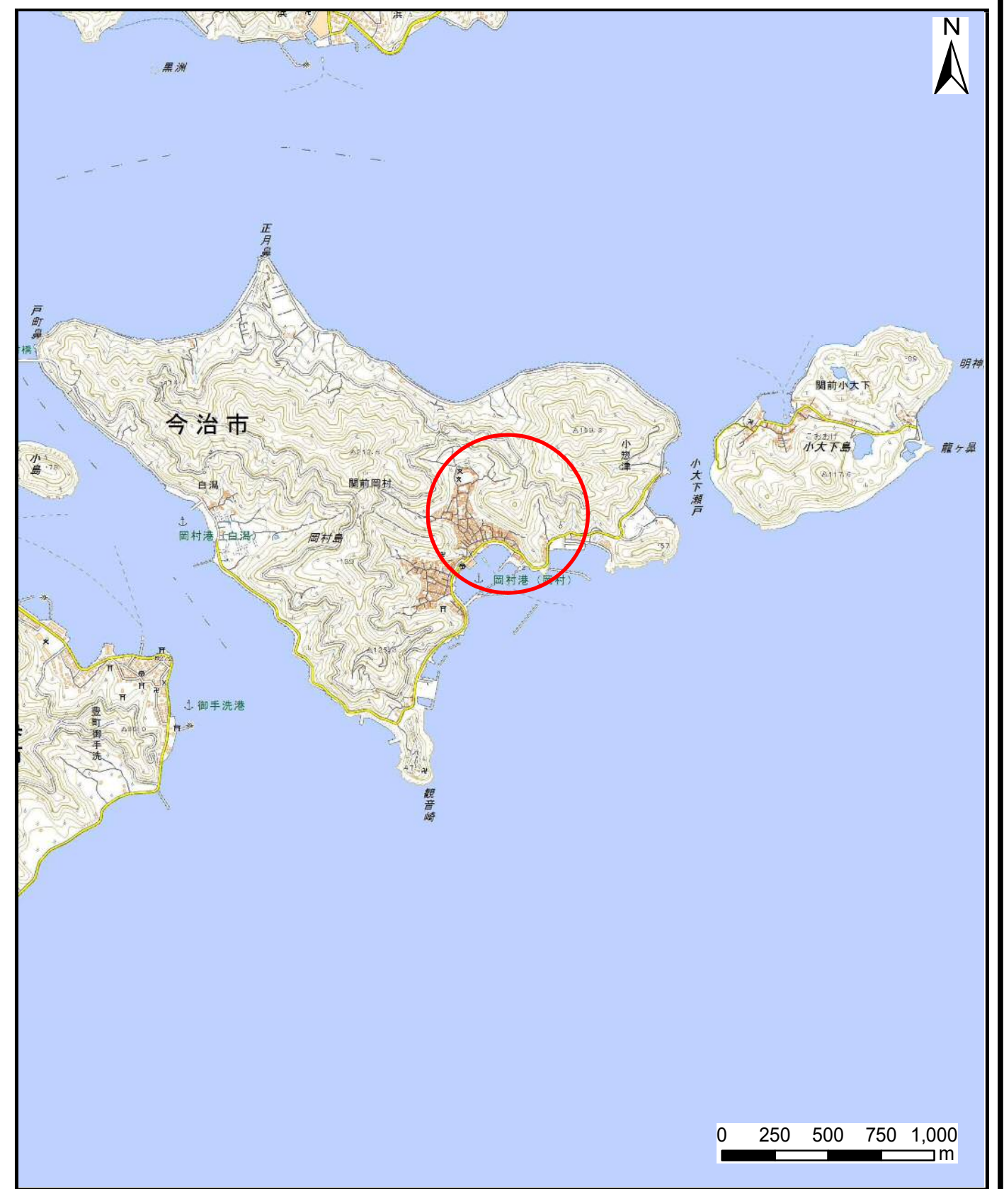
様式-1 (急) 土砂災害警戒区域・土砂災害特別警戒区域 位置図