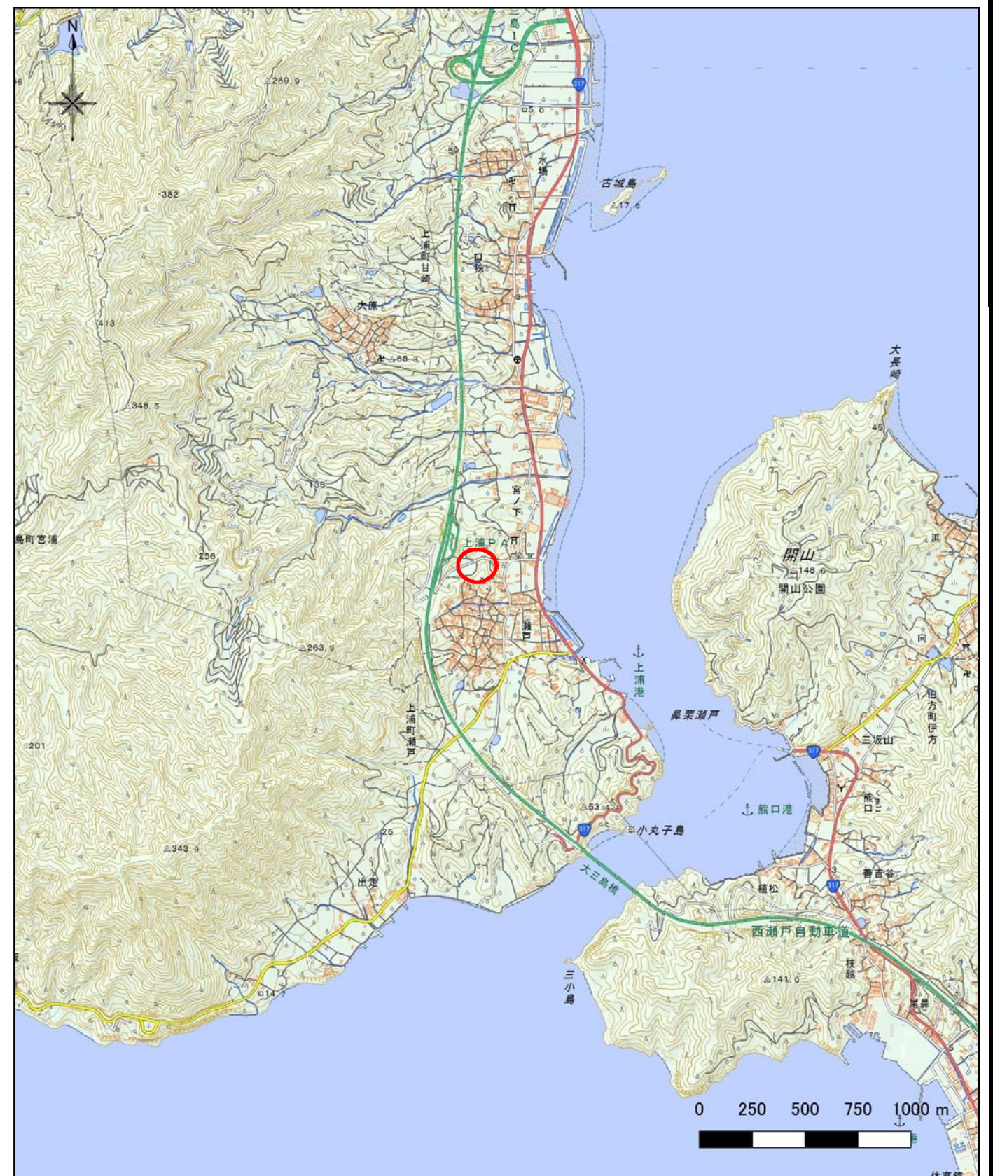
様式-1 (土) 土砂災害警戒区域・土砂災害特別警戒区域 位置図