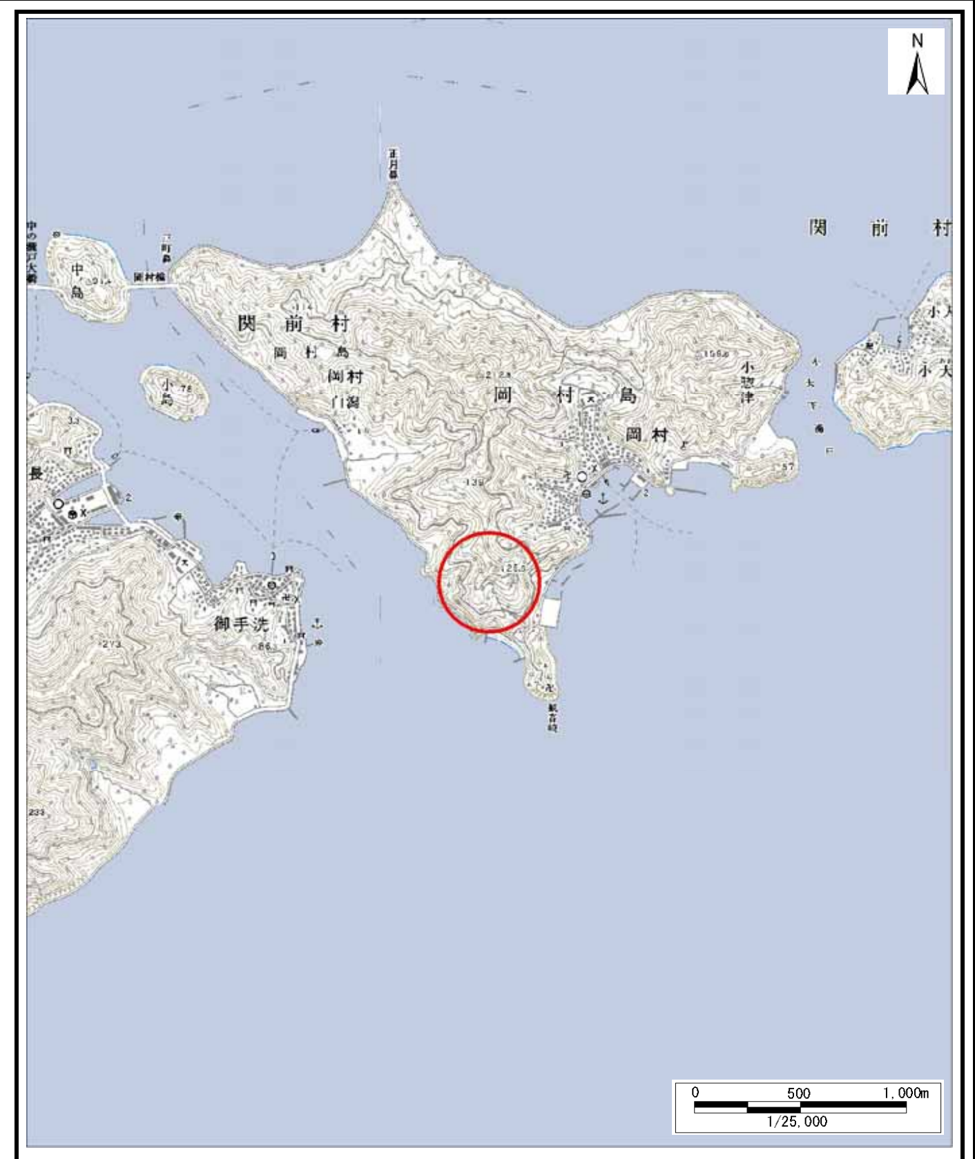
様式 - 1 (土) 土砂災害警戒区域・土砂災害特別警戒区域 位置図