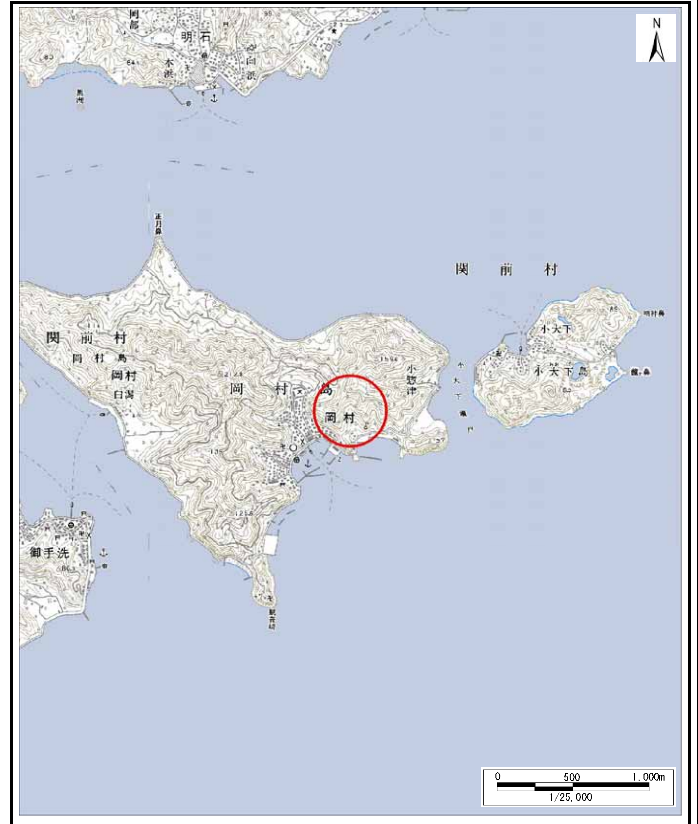
様式 - 1 (土) 土砂災害警戒区域・土砂災害特別警戒区域 位置図