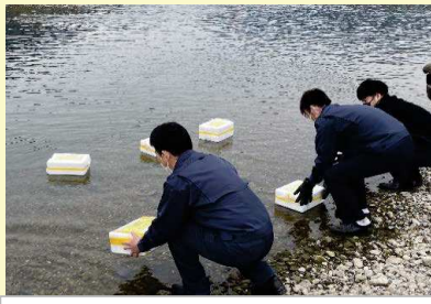
模擬ごみ投入：1月5日10時