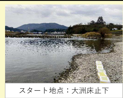
スタート地点：大洲床止下