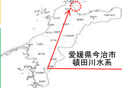
愛媛県今治市 頓田川水系