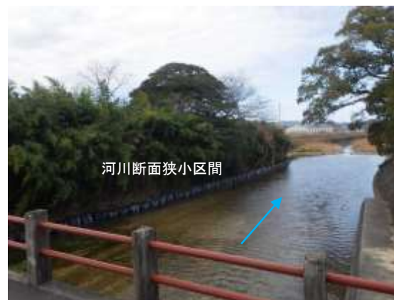
河川断面狭小区間