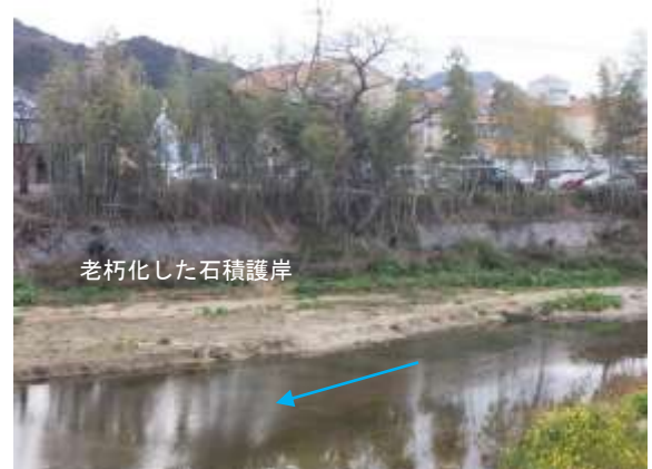
老朽化した石積護岸