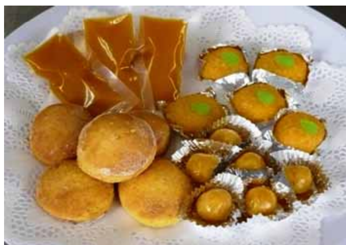
ギャバ富化果肉を用いた加工品 (ソース、スコーン、もち、あん玉)

果肉pHが、ギャバ生成能の高い果実を選抜する指標になることがわかりました。温州ミカン果肉のpHが3.9以上になるまで室温貯蔵することで、ギャバ含量400mg/100g以上の温州ミカン素材を得ることが出来ます。