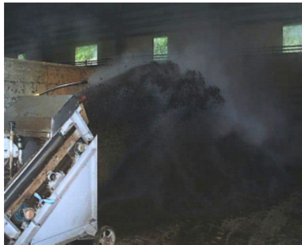
堆肥製造施設での利用例

環境浄化微生物のモニター試験結果、使い方や培養方法をまとめた「環境浄化微生物利用マニュアル」を作成しました。