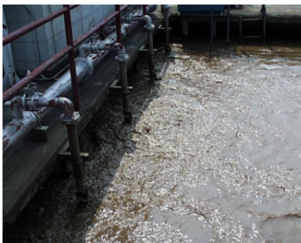
工場排水処理施設での利用例