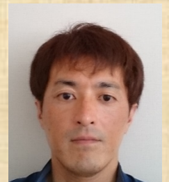
下田品質管理室長