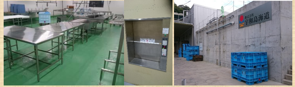
復旧後の加工場と修繕した設備