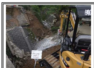
本復旧開始 (既設ブロック積取壊し)