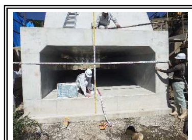
ボックスカルバート、路側擁壁完成