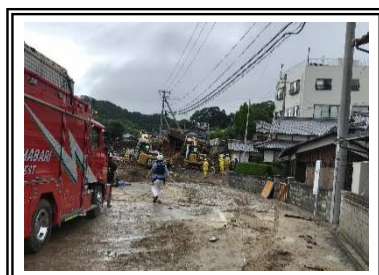
消防、警察、業者の復旧活動