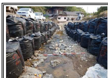
応急復旧（河道確保）完了