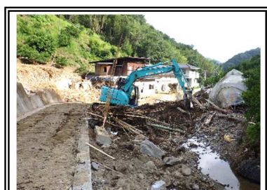
応急復旧（河道確保）状況