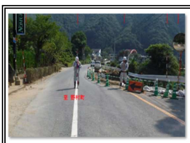
H30/7/10 応急復旧完了 (片側交互通行により解放)