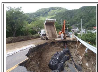
7/10 片側交互通行により解放