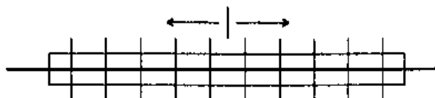
図4 - 1 ボルト締付け順序

なお、予備締め後には締め忘れや共まわりを容易に確認できるようにボルトナット及び座金にマーキングを行うものとする。これ以外の場合は、監督員の承諾を得なければならない。