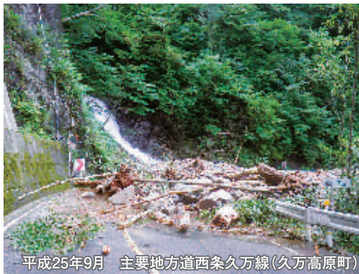
平成25年9月 主要地方道西条久万線(久万高原町)