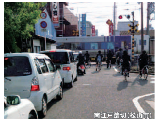
南江戸踏切(松山市)

市内交通の円滑化や、快適で魅力あるまちづくりなど、都市の機能強化に取り組むことが必要となっています。