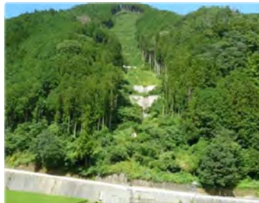
【山地災害跡地への 治山施設整備】