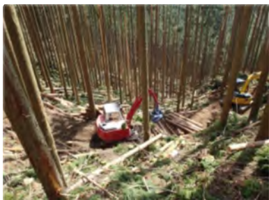
【高性能林業機械による 森林整備】

さらに、近年、ゲリラと呼ばれる集中豪雨により、県下でも山地災害が増加傾向にある中、被災した森林を早期に回復させるため、治山事業による施設整備を実施するほか、重要な水源地域や山地災害危険地区においては、森林の水源かん養機能や土砂流出防止機能等を高めるための森林整備を実施している。