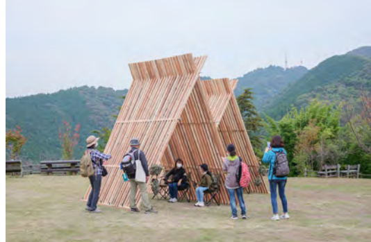
【えひめ山の日の集い(表彰式典・体験イベント)】