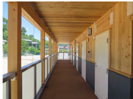
【県立内子高校 部室】