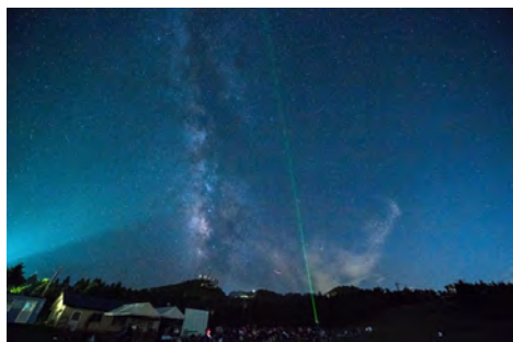
【エコツアー（星空観察）】