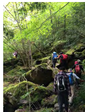
【エコツアー （面河古道ツアー）】