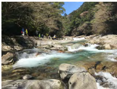
【エコツアー （面河溪谷トレッキング）】