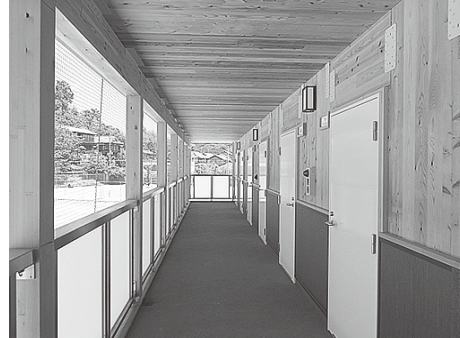
【県立内子高校 部室】