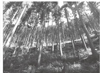
【森林の多面的機能を 高める整備】