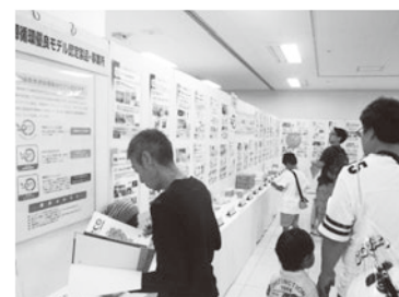
【「愛媛の3R企業展」開催状況】