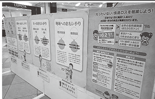
【「おもいやり消費普及啓発イベント」開催状況】