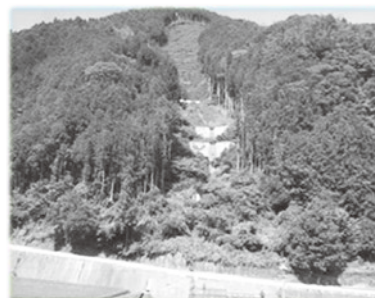
【山地災害跡地への 治山施設整備】