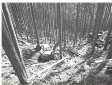
【高性能林業機械による 森林整備】

さらに、近年、ゲリラと呼ばれる集中豪雨により、県下でも山地災害が増加傾向にある中、被災した森林を早期に回復させるため、治山事業による施設整備を実施するほか、重要な水源地域や山地災害危険地区においては、森林の水源かん養機能や土砂流出防止機能等を高めるための森林整備を実施している。