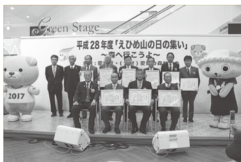
【えひめ山の日の集い】

当取り組みでは、森林に対する理解と保全活動への県民参加を促進する目的で、毎年、多くの県民の参加を得て「えひめ山の日の集い」を開催するとともに、ホームページや新聞広告等による啓蒙・普及を行った。また、森林保全等への県民自発的な参加を進めるため、市町や県民からの提案型公募事業に対する支援を行った。