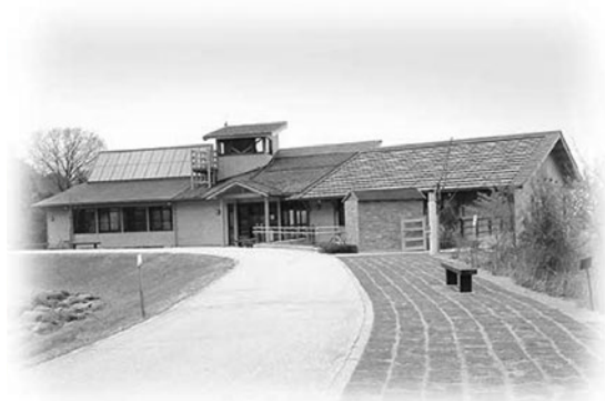
【えひめエコ・ハウス全景】

指定管理者制度の導入に伴い、平成18年4月からは、伊予鉄総合企画株式会社（旧社名：イヨテツケータサービス株式会社）に管理、運営を委託している。