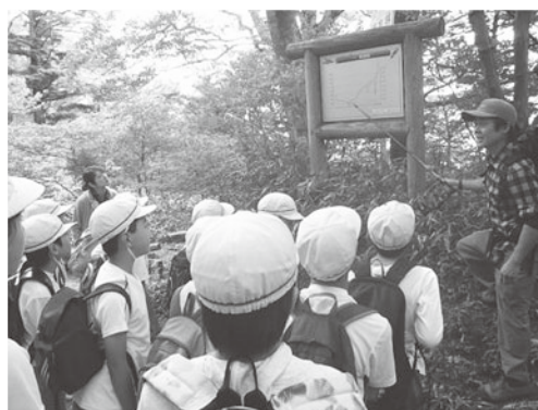
【環境マイスター活動状況】