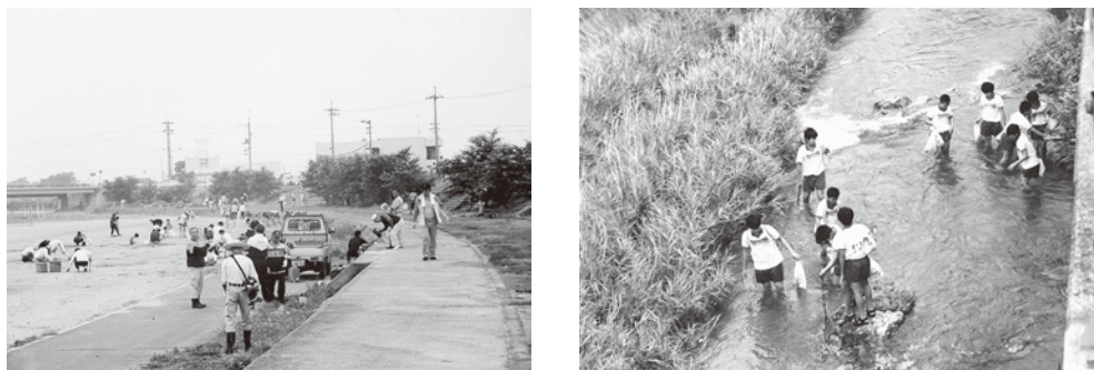
【愛リバー・サポーター清掃美化活動】

平成12年度の制度創設以来、平成30年度末現在で県下20市町の107河川で261団体を認定し、各団体において清掃美化活動等が実施されており、各団体の構成員総数は17,917人、サポーター区間延長は約185kmにも及んでいる。