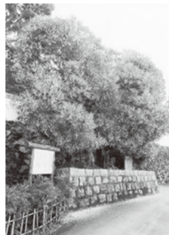
【西条王至森寺の金木屋】