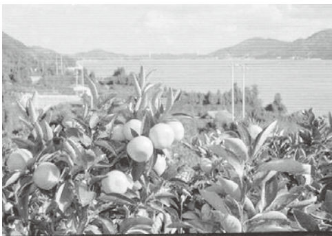
【西宇和の温州みかん】

この事業に本県からは、「愛媛西宇和の温州みかん」（愛媛県）、「西条王至森寺の金木屋 さいじょうおうしもりじ きんもくせい 」（西条市）、「内子町の町並みと和ろうそく」（内子町）の3件が認定された。