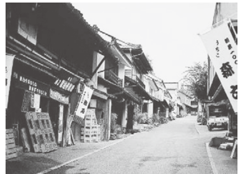
【内子町の町並みと和ろうそく】