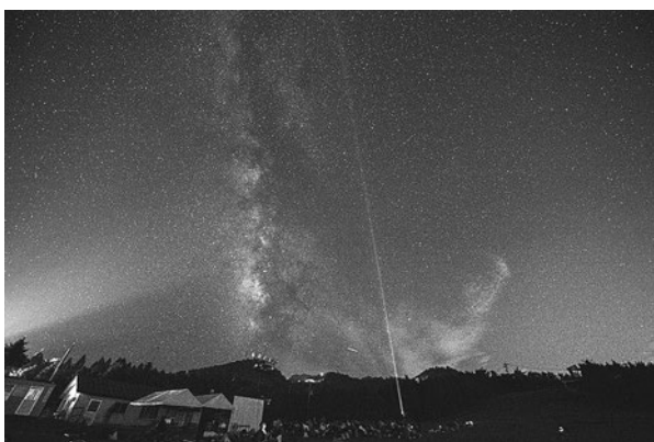
【エコツアー（星空観察）】