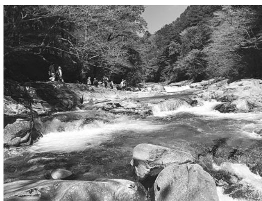
【エコツアー（面河溪谷トレッキング）】