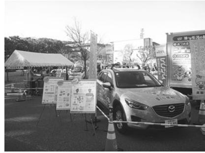
【バイオディーゼル燃料普及啓発イベント】