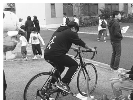
【学生祭での普及啓発】

内容：スポーツサイクルについて紹介することで、自転車通学に対する興味・関心を高め、自転車利用の促進や温暖化防止の啓発を図った。