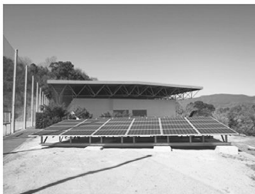
【第3号南予レク都市公園】