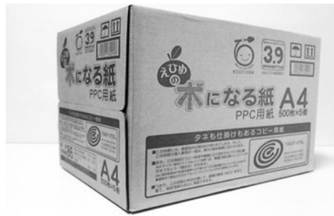
【えひめの木になる紙】

また、24年度からは、大王製紙(株)を中心に森林組合やチップ加工業者らで構成する「えひめの木になる紙生産推進グループ」による、県産間伐材を利用したコピー用紙を（「えひめの木になる紙」）平成25年4月からの販売しており、29年3月末までに28,965箱（売上高：53,615,380円）を販売した。