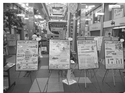
【都市イベントの様子】