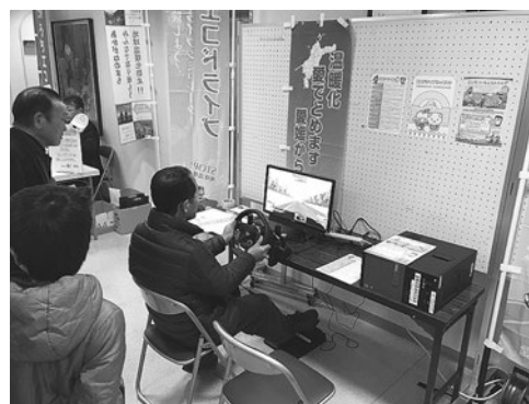
【ドライブシミュレータによる診断の様子】