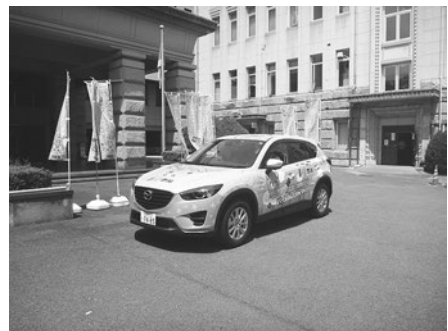
【バイオディーゼル燃料普及啓発車両】