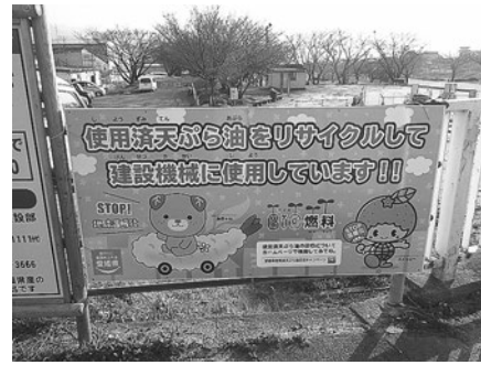
【工事現場における掲出】