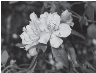
トキワバイカツツジ