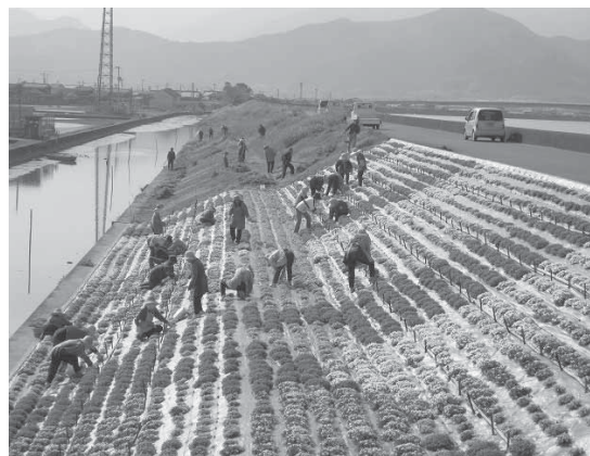
農家を含めた地域住民の植栽活動