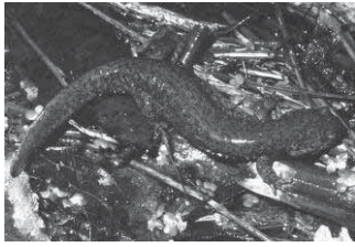
カスミサンショウウオ