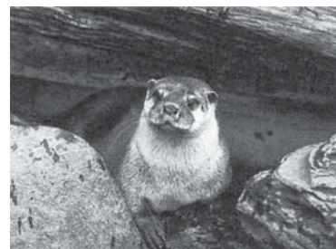
ニホンカワウソ

これまでに、陸産哺乳類は47種が確認されているが、開発等により生息環境は悪化の一途をたどり、多くの種が生息地の分断に伴い、繁殖群の孤立化など個体数の減少が懸念されている。中でも、ツキノワグマ、ニホンカモシカ、ニホンカワウソは生息に