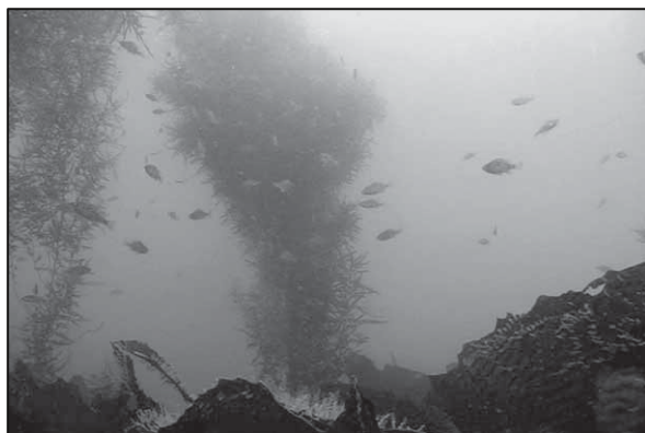
(増殖礁に繁茂した海藻)