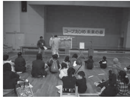
県民参加の森設置・提供事業 (活動フィールドの整備と提供)