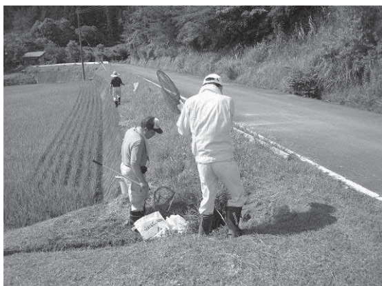
環境概査（現地調査）の状況

された「愛媛県農業農村整備事業に係る環境情報協議会」の意見を踏まえ、環境配慮対策を検討し、事業の実施に反映させることとしている。