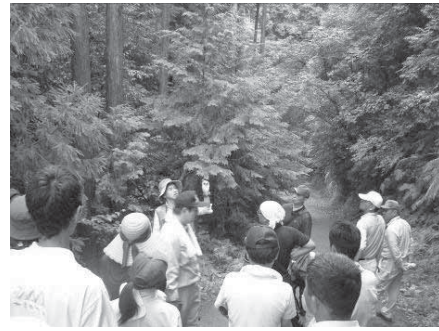
森とのふれあい活動促進事業 (県民の森林づくり活動を支援)