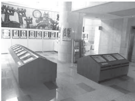
巡回展「森の博物館」開催事業 (森林や自然に関する展覧会の開催)