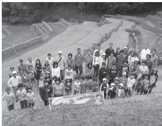
棚田ふれあい教室