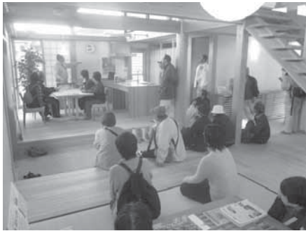
県民と森との交流促進事業 (県民と森との交流促進)