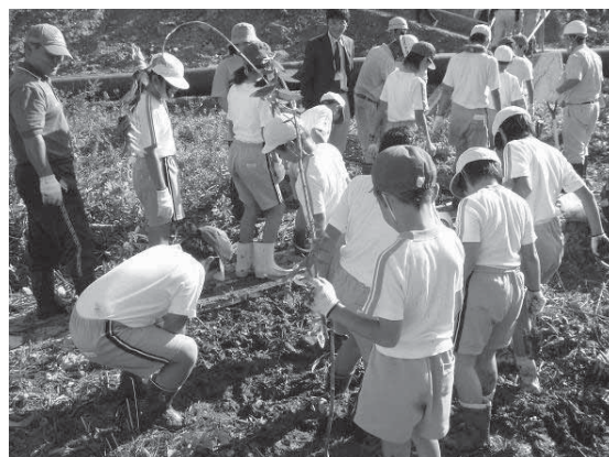
環境配慮事例（移植活動）