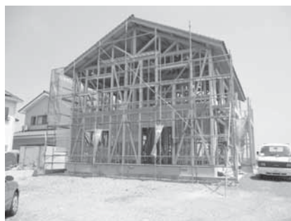
えひめ材住宅普及啓発事業 (木造住宅の建設を促進)