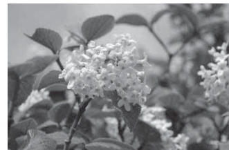
チョウジガマズミ