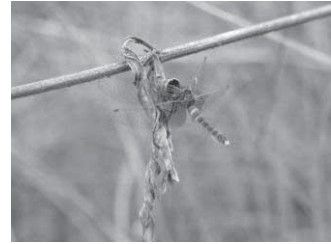
ハッチョウトンボ