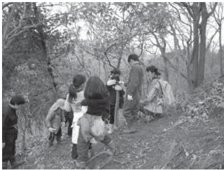
自然観察会開催事業 (青少年を対象とした自然観察会)