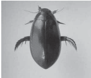
コガタノゲンゴロウ