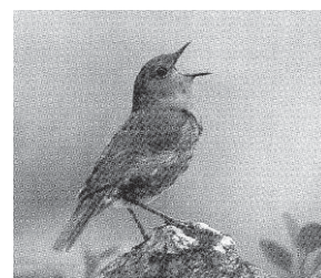
コマドリ

322種と10亜種が確認されており、迷鳥を除くと冬鳥が多く、夏鳥が少ない特徴がある。生息種は県内の多様な自然環境を反映し、石鎚山系など標高の高い所にはホシガラスなどが生息している。加茂川河口や重信川河口などの干潟には、春と秋にシギ・チドリ類が訪れ、ダム湖やため池には、冬期にカモ類が越冬のために訪れる。ツルやコウノトリの越冬地としても特定の里地や干潟などの生態系が残されている。瀬戸内海から宇和海の島嶼部にはカラスバトが生息し、オオミズナギドリの繁殖が確認されている島もある。佐田岬半島や愛南町の高茂岬は、渡りの季節に多くのタカ類や小鳥類が通過するルートになっている。