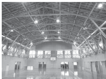
公共施設木材利用推進事業 (公共施設の木造化)