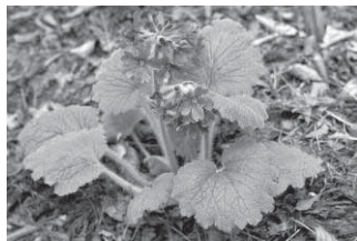
シコクカッコソウ