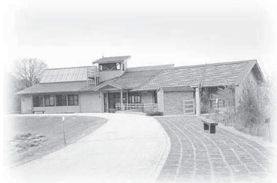
えひめエコ・ハウス全景

指定管理者制度の導入に伴い、平成18年4月からは、イヨテツケーターサービス株式会社に管理、運営を委託している。