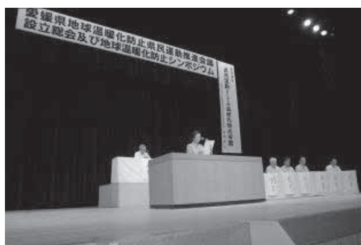
〔愛媛県地球温暖化防止県民運動推進会議設立総会〕

県では、同会議を核として、企業や団体、自治体など、各主体間での情報交換や連携を密にし、より効果的な温暖化対策を推進しており、家庭・オフィス・工場・運輸などの各部門においても、適正な冷暖房温度の設定、クールビズ、エコドライブなど、温暖化防止に向けた身近なところからの取組が進められている。