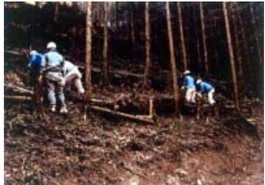
「ボランティアの森整備事業」（西条市小松）