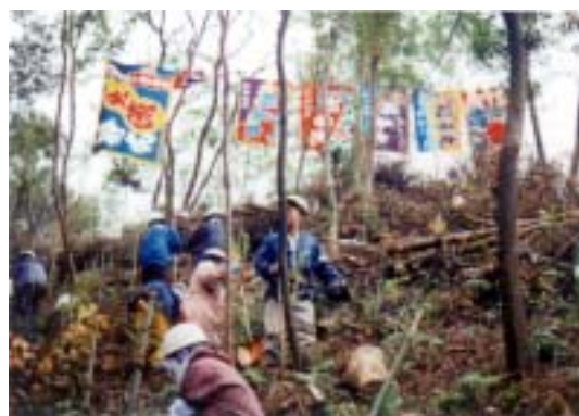
漁民の森づくり活動