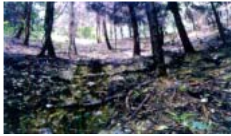
林床には植生がなく、地表を流れ下る雨水により表土が流亡している。