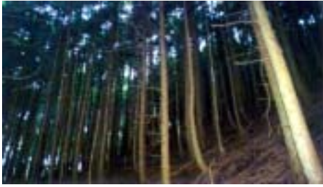
林内は真っ暗で、植栽木は不健全であり枯死が見られる。