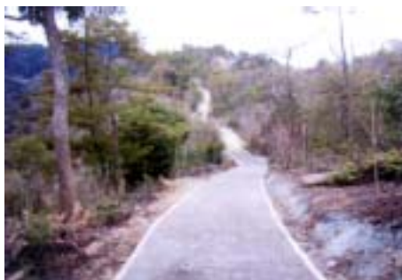
県民参加の森設置・提供事業 (拠点フィールド管理道開設)