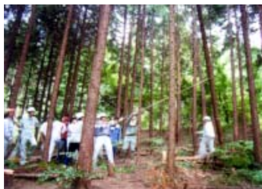
「森林とふれあう高校生の集い」