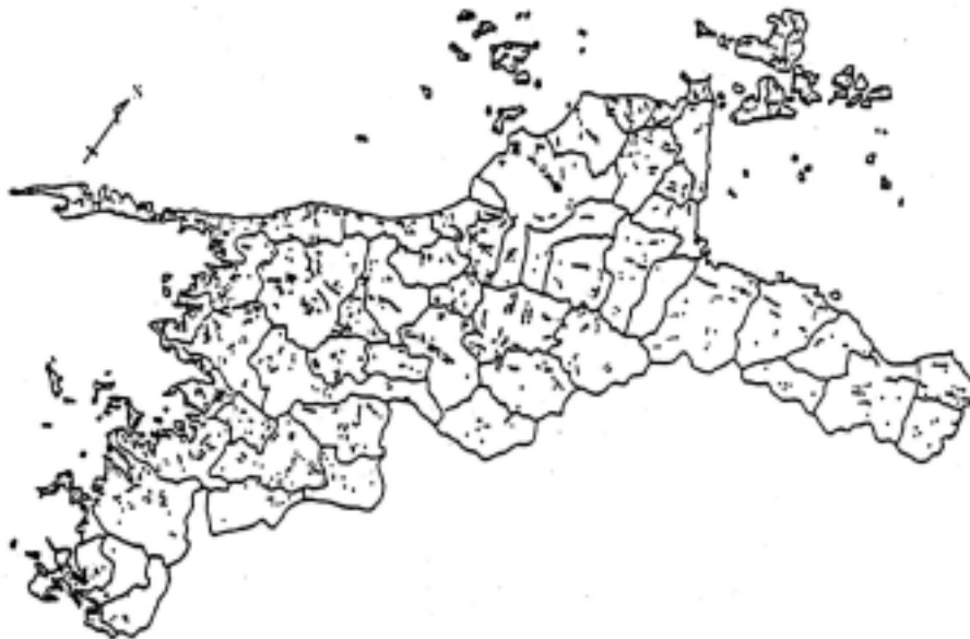
図2 - 11 - 1 土石流危険渓流分布図（平成15年3月作成）

土石流危険渓流は、県内には5,877渓流あり、全国第9位にランクされている。そのうち南予地方の割合が53%と全県の半分以上を占めている。