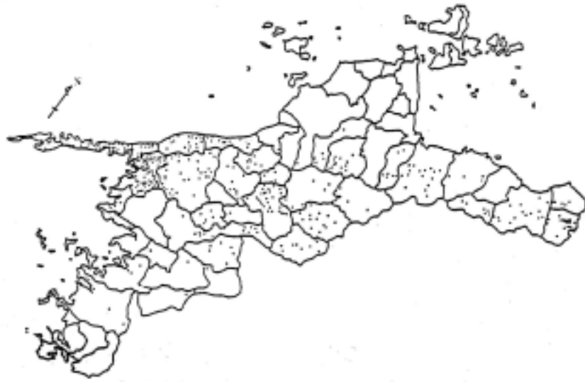
図2 - 11 - 2 地すべり危険箇所分布図（平成15年3月作成）