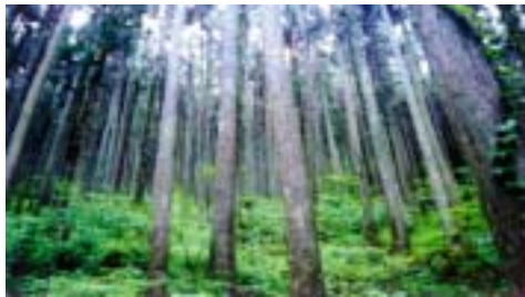
強度な間伐等の実施により、5～10年後には広葉樹をはじめとする様々な植生がみられる。