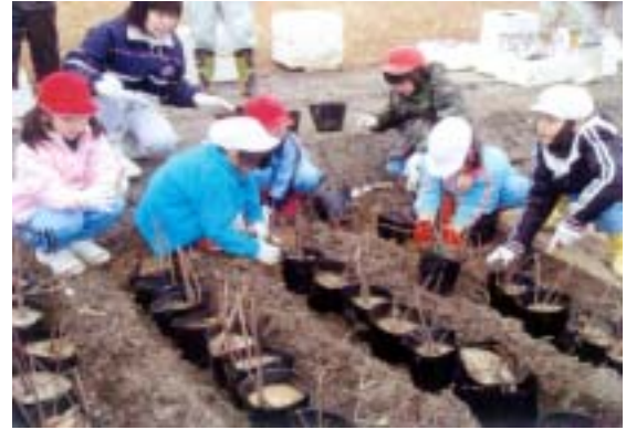
シロネの移植状況