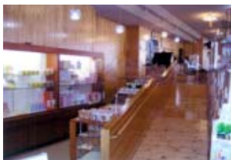
木の香る環境づくり促進事業 (内装木質化)