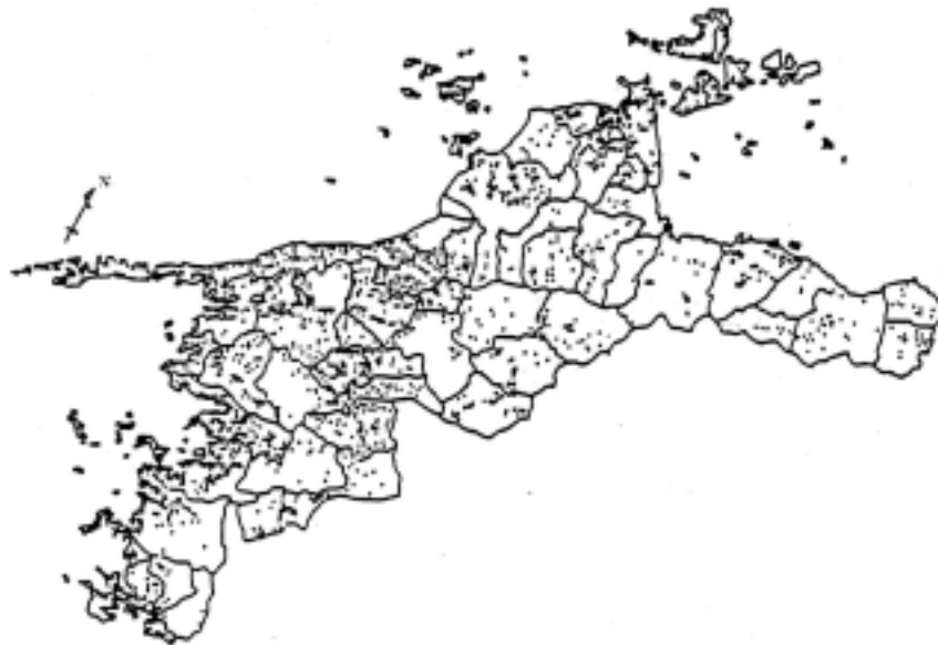
図2 - 11 - 3 急傾斜地崩壊危険箇所分布図（平成15年3月作成）

急傾斜地崩壊危険箇所は、県内には8,807箇所あり、全国第17位にランクされている。そのうち南予地方の割合が56%と全県の半分以上を占めている。