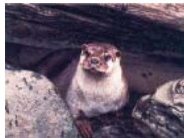
ニホンカワウソ

イノシシ、テン、ムササビは、低山から1,000m以上の山地まで全県下に広く生息している。近年、イノシシによる農作物への被害が増加している。