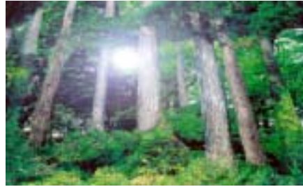
約50年後を目標に、上層の針葉樹大径木と下層の広葉樹群から成る「えひめの森林」を実現。