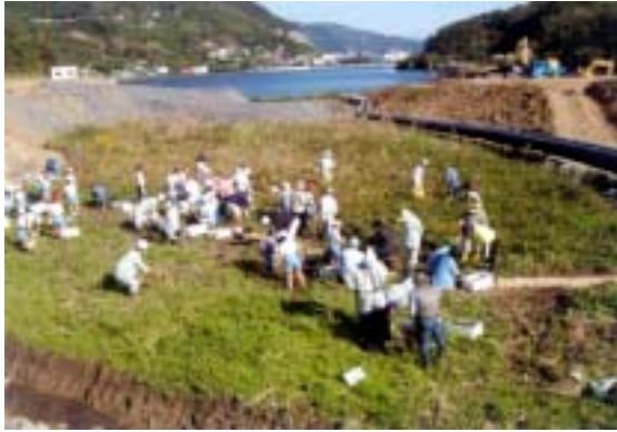
一時避難の作業を行う地元小学生