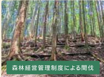
森林経営管理制度による間伐