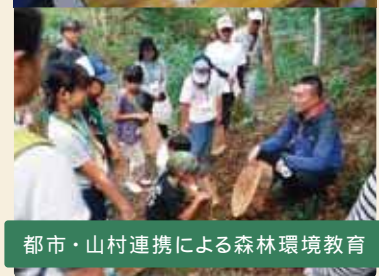
都市・山村連携による森林環境教育