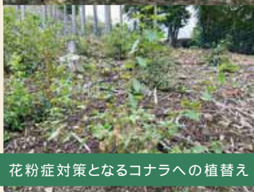
花粉症対策となるコナラへの植替え