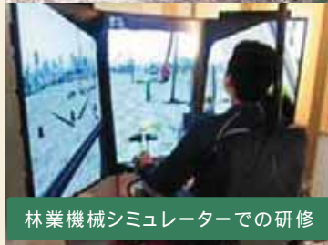
林業機械シミュレーターでの研修