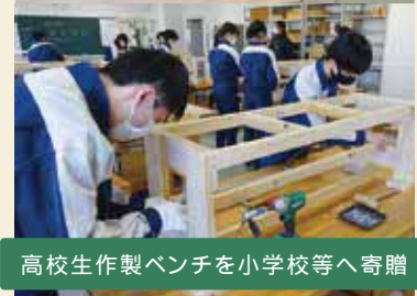
高校生作製ベンチを小学校等へ寄贈