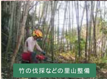
竹の伐採などの里山整備