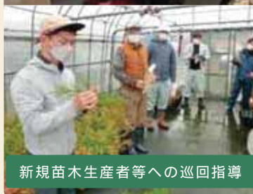
新規苗木生産者等への巡回指導