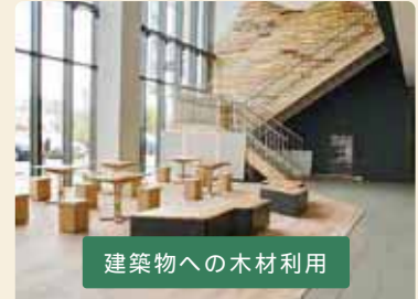
建築物への木材利用