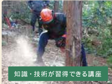
知識・技術が習得できる講座